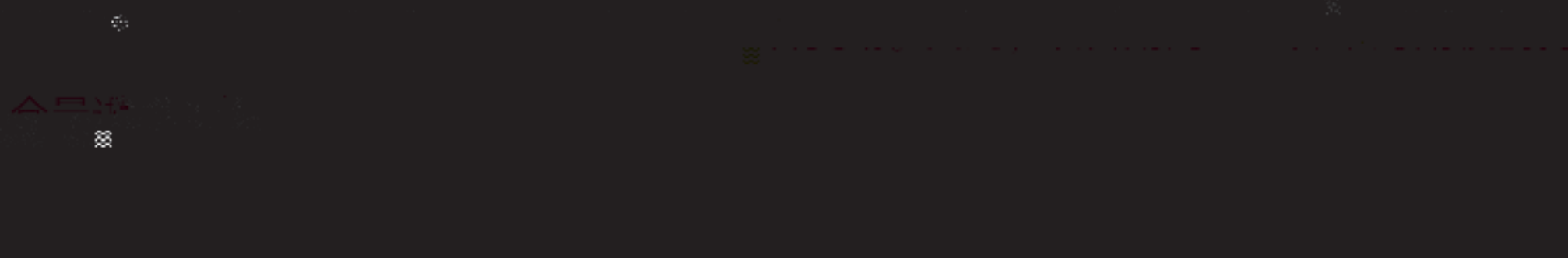
图3 Delta及隐含波动率走势。

因首次尝试，套保现货量控制在2万吨，入场时行权价为700元的看跌期权delta值为-0.2左右（图3）。为保持Delta中性，因此企业将期权现货持仓比例保持在5:1，5倍期权的Delta值= -0.2 * 5 = -1，简单而言，标的价格每降低1元，5倍期权获利1元，1倍现货库存损失1元，两者形成对冲，整体的期现货损益不受标的价格的趋势性变动影响。项目持续时间为2月8日至16日，铁矿石的基差由约160元/吨变为约150元/吨，整体保持平稳。